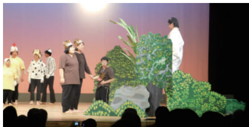
↑民話劇「十二支の話」 (名護市手をつなぐ育成会)