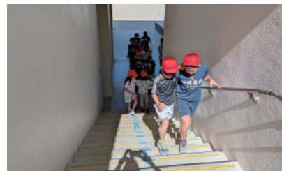
名護小学校 アイマスク体験