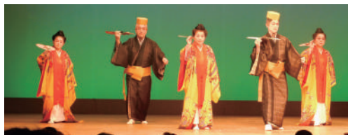
↑「かぎやで風(知名士舞踊)」