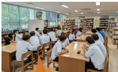
名護商工高校 体験講話