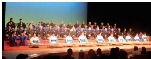
↑古典音楽斉唱による幕開け (野村流古典音楽協会名護支部、琉球箏曲興陽会北部支部)

去る11月23日(日)に第39回 名護市民劇が開催されました。市民劇開催にあたりご尽力いただいた皆様に改めてお礼申し上げます。誠にありがとうございました。