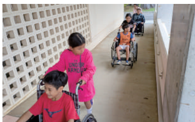
安和小学校 車イス体験

※「生活障害体験学習」は皆様からご協力いただいた「 赤い羽根共同募金 」の配分金を受けて実施されています。