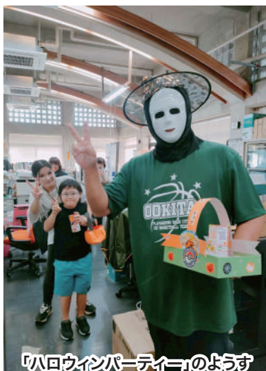
「ハロウィンパーティー」のようす