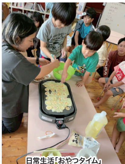
日常生活「おやつタイム」