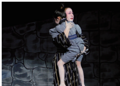
↑時代人情劇「太陽乃子(ていーだぬふあ)」