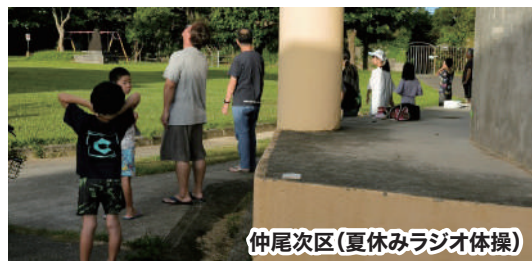
仲尾次区(夏休みラジオ体操)