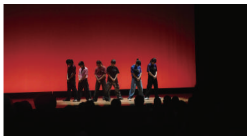
↑ダンスパフォーマンス (沖縄県立名護高等学校 ダンス部)