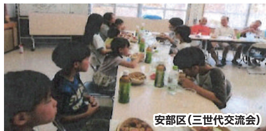
安部区(三世交代交流会)

本事業では、公民館等で子どもを対象としたイベントや活動(長期休みのおやつや軽食付き居場所や視察・体験活動)にお菓子や食料品、日用品等の配布を活用し、地域の子どもの公民館活動に参加しやすい機会をつくっていただきました!