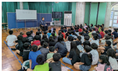
大北小学校 体験講話