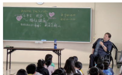
大宮小学校 体験講話