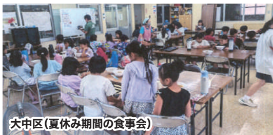
大中区(夏休み期間の食事会)