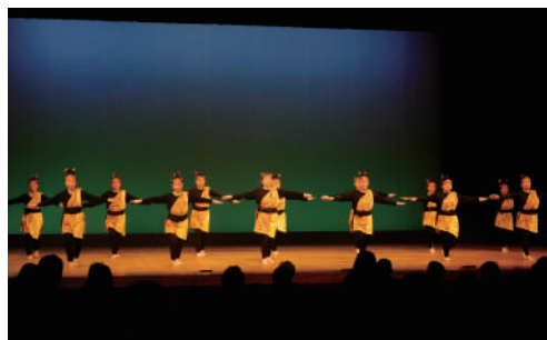
↑かりゆし大漁節、だんじゅかりゆし (名護市女性会)